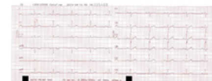
12 formas de onda ECG Vários formatos de impressão para atender diferentes necessidades