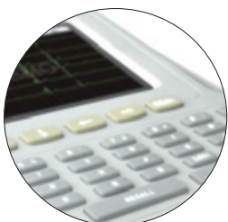
Teclado Alfanumérico Com Iluminação