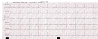
Gravação Rítmica Uma derivação ou três derivações selecionáveis