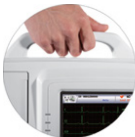
Design Portátil e Leve