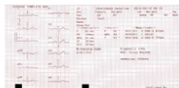
Interpretação Modelo de formas de onda média