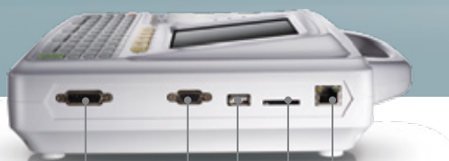
Cabo ECG Porta Serial USB Cartão SD PC Ethernet