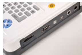
Memória para até 300 exames USB para transmissão de dados Software PC-ECG (Opcional) Suporta impressora externa