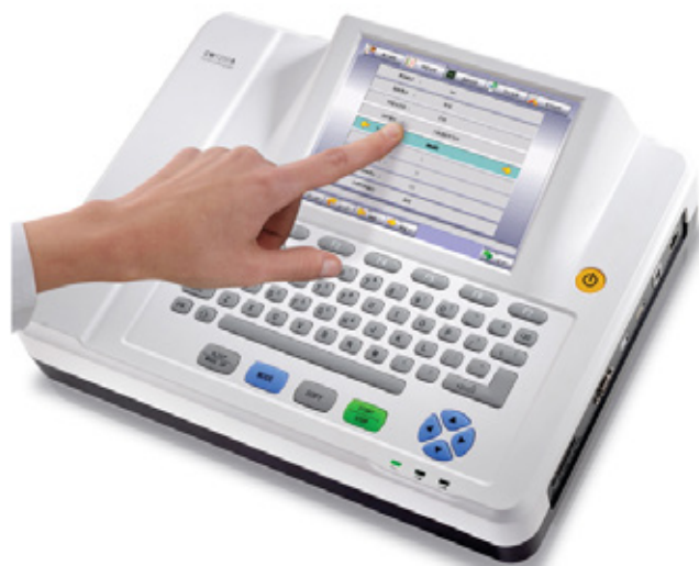
Tela Touch-Screen Colorida de 8.4 Polegadas